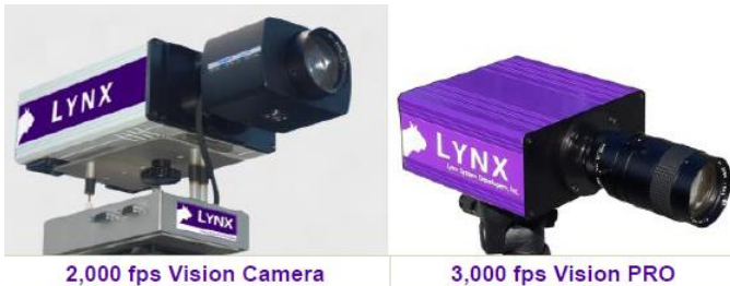
2,000 fps Vision Camera